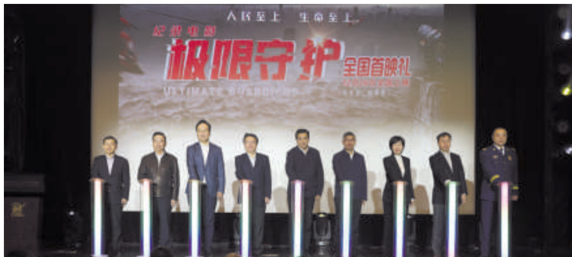
嘉宾共同为纪录电影《极限守护》全国首映礼启幕

12月19日,纪录电影《极限守护》全国首映礼在京举行。应急管理部原副部长、中国灾害防御协会会长郑国光,应急管理部办公厅主任股本杰,应急管理部新闻宣传司司长申展利,中宣部电影局副局长陆亮,中央新闻纪录电影制片厂(集团)党委书记、董事长姚永晖,应急管理部国家减灾中心主任石峰,中央新闻纪录电影制片厂(集团)党委副书记、总经理仇东方,原国家广电总局电影局局长刘建中,华夏电影发行放映有限责任公司副总经理黄群飞,国家消防救援局新闻发言人孙毅军等参加活动并共同启动首映。活动由中央新闻纪录电影制片厂(集团)副总经理朱勤效主持。