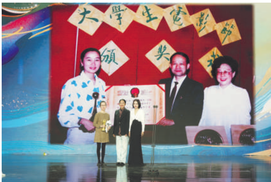
最受大学生欢迎年度女演员吴倩