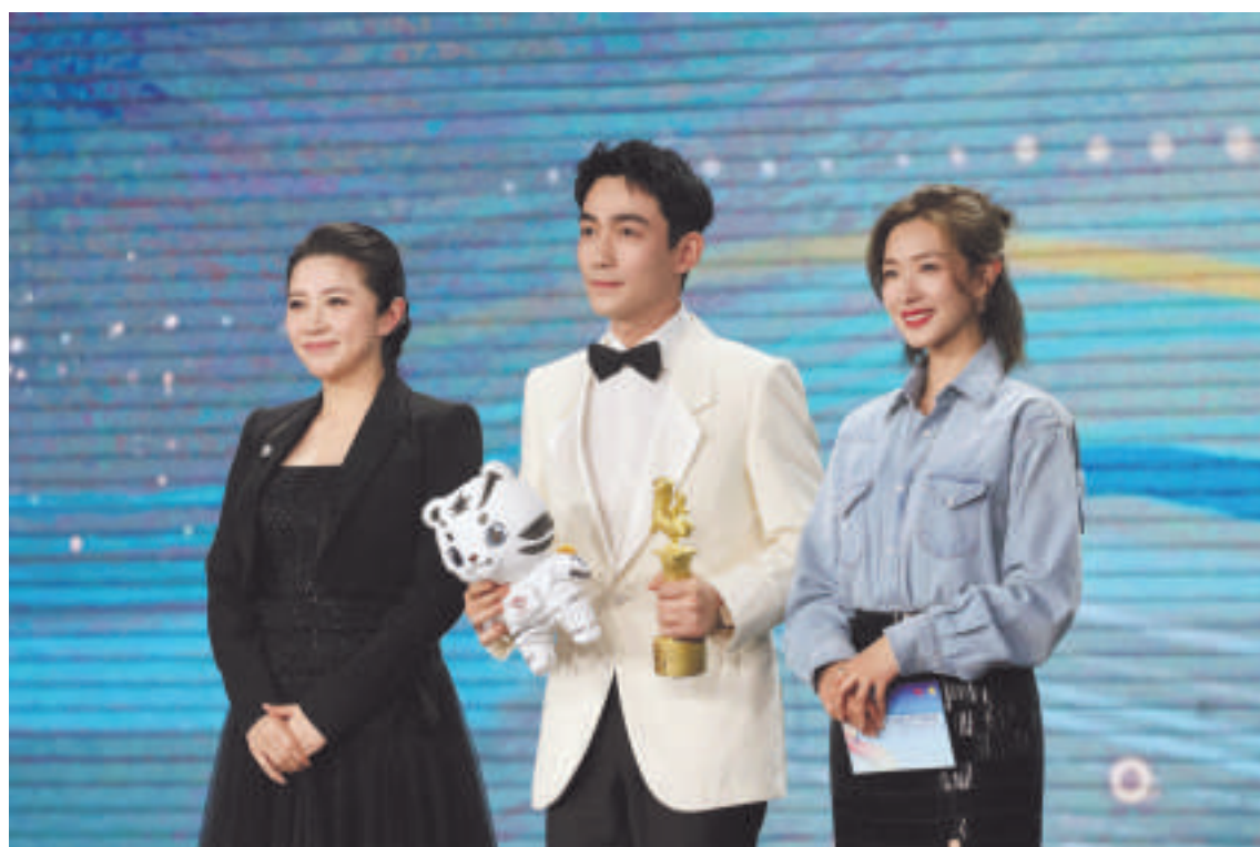
最受大学生欢迎年度男演员朱一龙

肖向荣表示,近些年来,大影节把电影美育从城市带入乡村,又从乡村回归城市,还走进了社区。借助电影这一媒介交流、激发碰撞,连通不同文化的桥梁,大影节也逐渐从当年的校园文化活动蜕变成了一年一度的全国性文化事件。