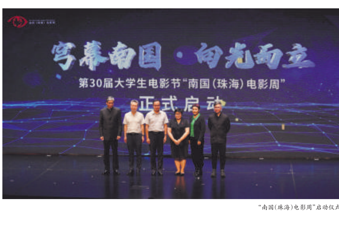
“南国(珠海)电影周”启动仪式