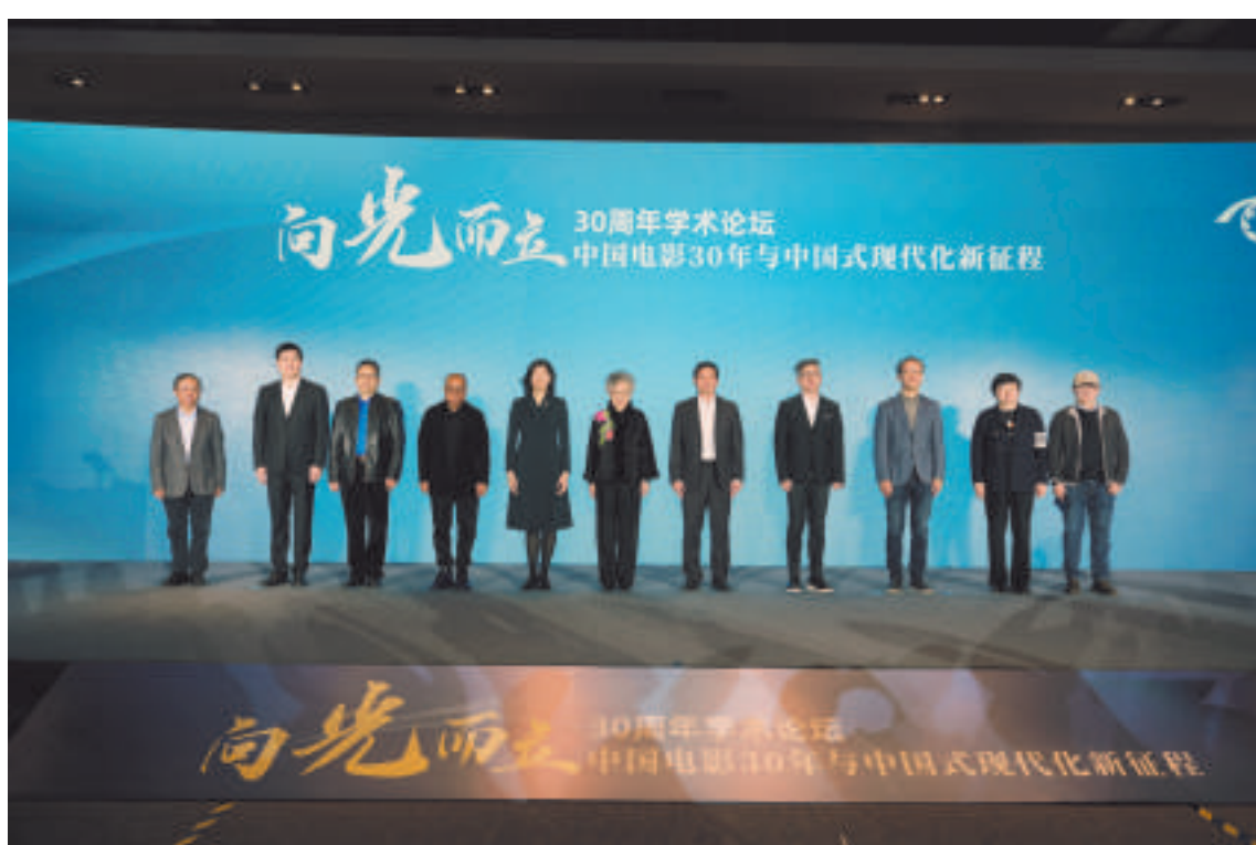
“向光而立,中国电影30年与中国式现代化新征程”论坛嘉宾合影