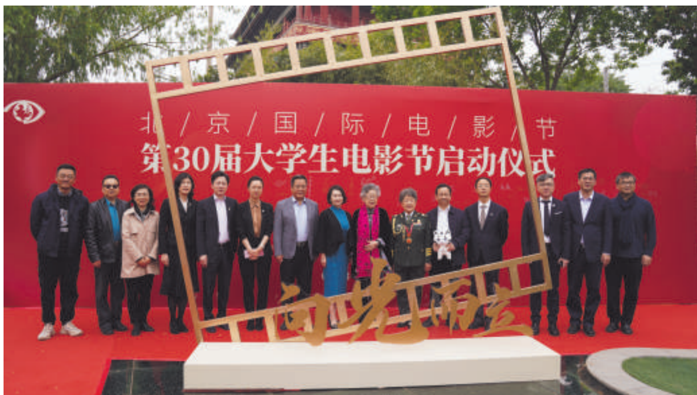
第30届大学生电影节启动仪式嘉宾合影