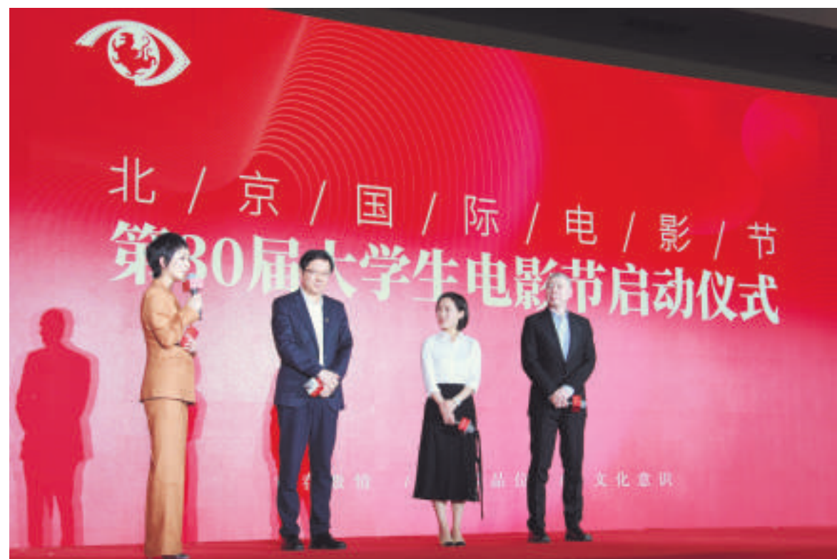
“向光而行——大学生电影节30周年特别对话”环节