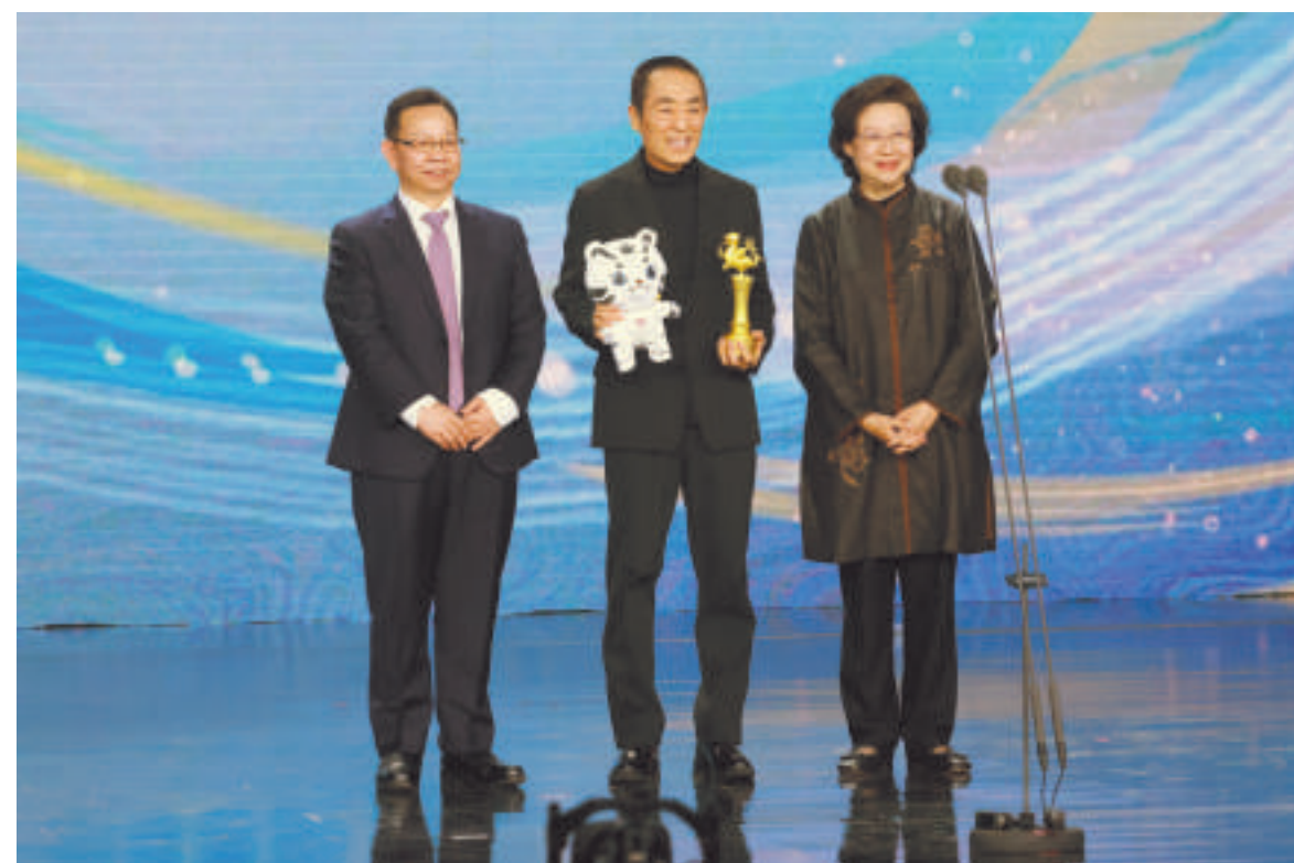
最受大学生欢迎年度导演张艺谋