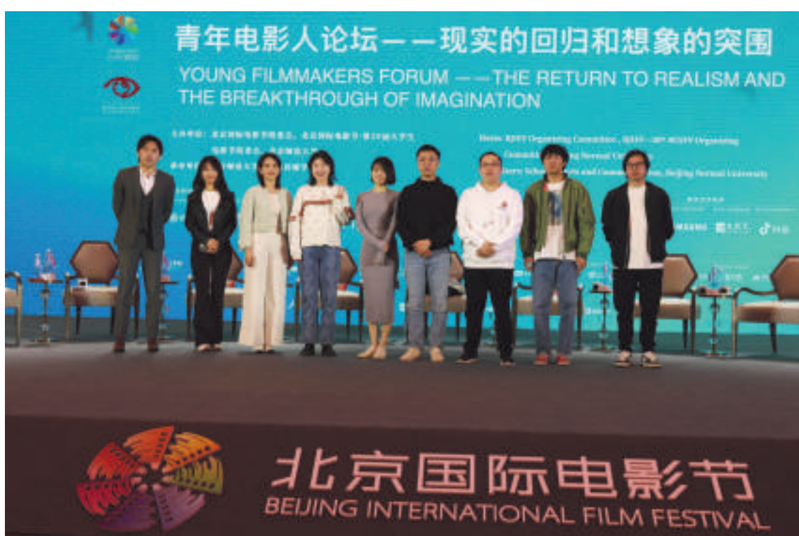
“现实的回归和想象的突围”青年电影人论坛嘉宾合影