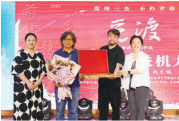
出品方代表祝贺影片杀青

本报讯 7月6日,电影《觅渡》在常州市第二中学迎来了全片的封镜。常州市委宣传部副部长、市新闻出版局(版权局)局长谢春林代表“常州三杰”的家乡常州,代表电影的出品方、承制方来到现场,祝贺电影《觅渡》顺利杀青。