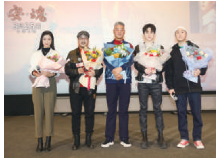
影片主创与观众见面

本报讯 由日向寺太郎导演执导，富川元文编剧，改编自茅盾文学奖得主周大新的同名小说的电影《安魂》在中国电影资料馆举行了以“唯爱长存”为主题的首映礼。中国作家协会主席铁凝等出席活动。