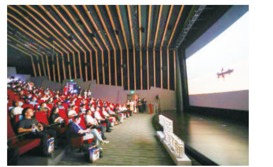
“光影重启 聚力江南”2020年江南电影大会开幕仪式