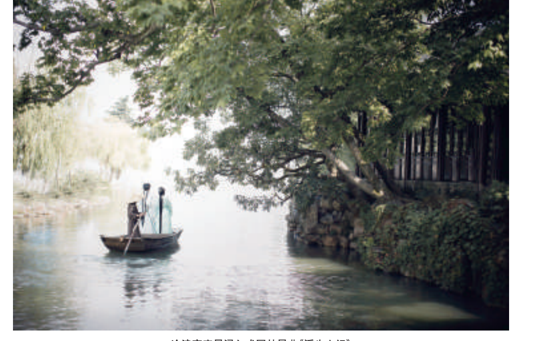
沧浪亭实景浸入式园林昆曲《浮生六记》

已于8月28日盛大开幕,将在10月15日闭幕! 多部精品剧目、小剧场演出、多场高规格书画展览、多个文旅融合产品 集中呈现“江南小剧场”将推套票、亲子票等优惠措施 面向市民发放30万张9.9元观影券 苏州园林推出“1元游园林活动百万大馈赠”活动 江南花卉艺术展览会送出20万张免费门票