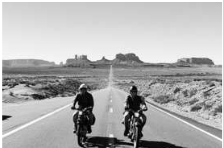
《Ausgrissen! In der Lederhosen nach Las Vegas》