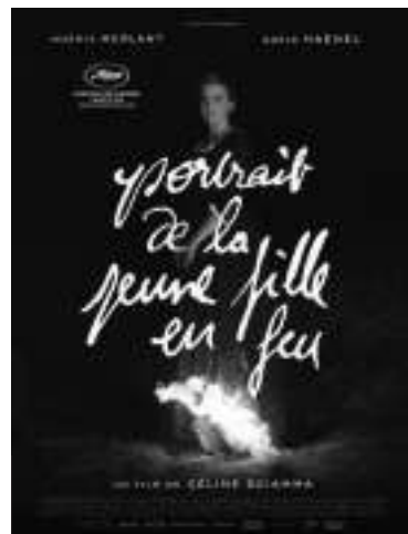
《燃烧女子的肖像》 编剧:瑟琳·席安玛 导演:瑟琳·席安玛 主演:阿黛拉·哈内尔、诺米·梅兰特