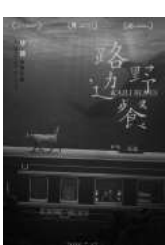
《路边野餐》 编剧:毕赣 导演:毕赣 主演:陈永忠、郭月