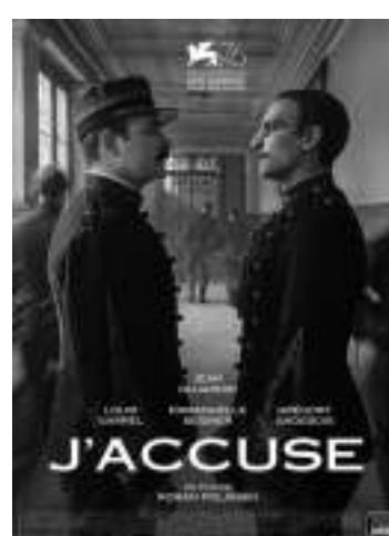
《我控诉》 编剧:罗曼·波兰斯基、罗伯特·哈里斯 导演:罗曼·波兰斯基 主演:让·杜雅尔丹、路易·加瑞尔