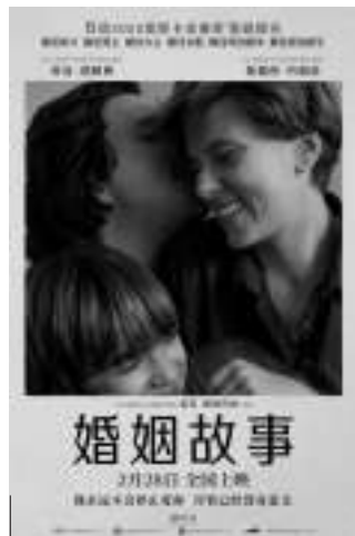
《婚姻故事》 编剧:诺亚·鲍姆巴赫 导演:诺亚·鲍姆巴赫 主演:亚当·德赖弗、斯嘉丽·约翰逊、劳拉·邓恩