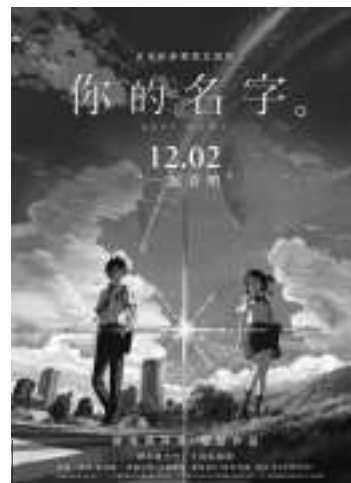
《你的名字》 编剧:新海诚 导演:新海诚

我一直喜欢动画片,宫崎骏等日本动画电影我都很喜欢。这部片子的故事涉及穿越时空,我本来就对科幻类感兴趣,尤其是穿越时空。影片剧情非常烧脑,在穿越中情感来回跳跃,时空不断变化,这种设定自带间离效果,更容易有戏、有故事。