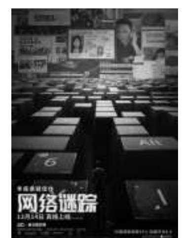
《网络谜踪》 编剧:阿尼什·查甘蒂、赛弗·奥哈尼安 导演:阿尼什·查甘蒂 主演:约翰·赵、黛博拉·梅辛、米歇尔·拉