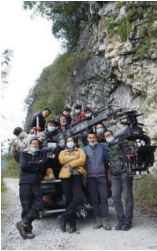
苗月导演《秀美人生》广西开拍

天空之城影业创始人路伟更关注复工后的产业链效率,例如影院要加强用户经营、场景拓展、衍生品开发、线下线上的融合。