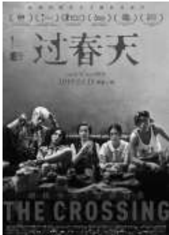
《过春天》 编剧:白雪/林美如 导演:白雪 主演:黄尧 孙阳 倪虹洁