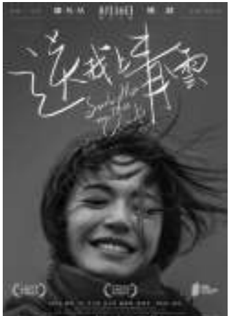
《送我上青云》 编剧:滕丛丛 导演:滕丛丛 主演:姚晨 袁弘 李九霄