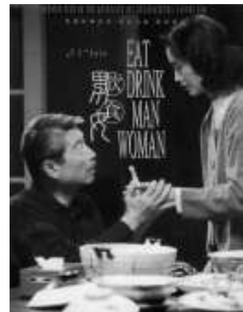
《饮食男女》 编剧:李安 詹姆斯·沙姆斯 王蕙玲 导演:李安 主演:吴倩莲 杨贵媚 张艾嘉