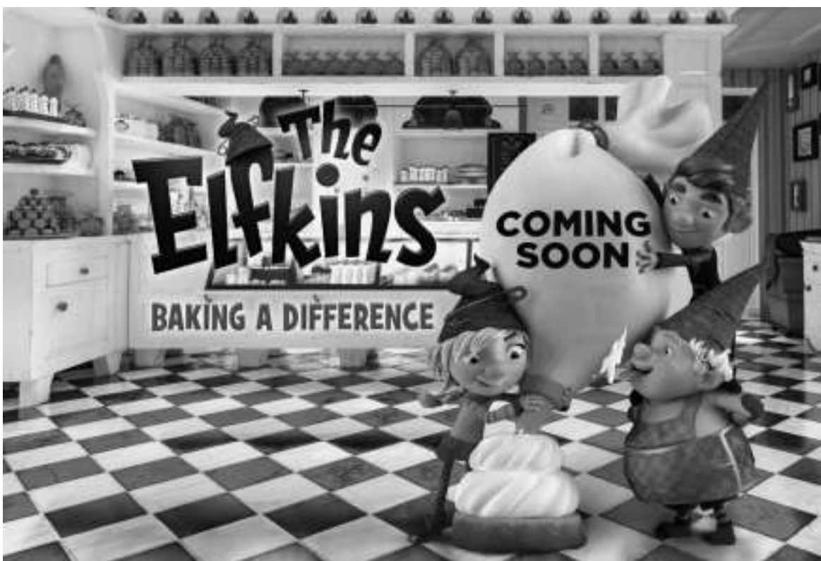
《The Elfkings — Baking a Difference》