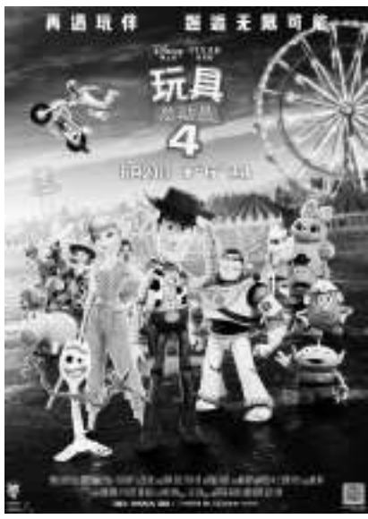
《千与千寻》与《玩具总动员4》单日票房(仅供参考)